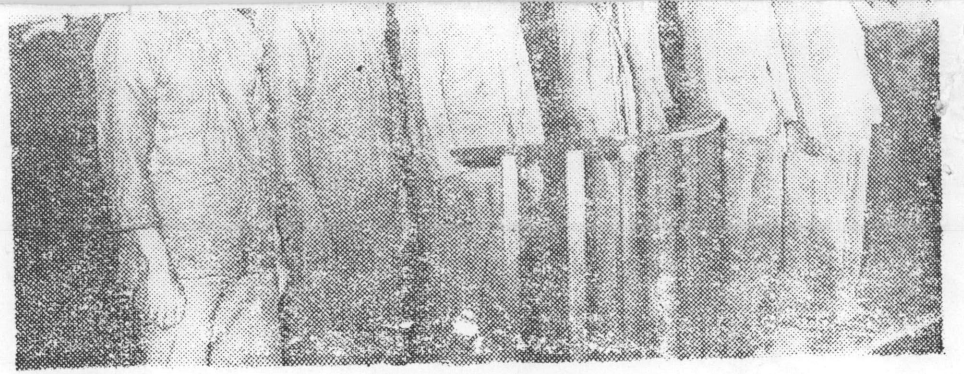
ជនក្បត់ឈ្មោះ : កែប - បៃ , សុក - សំ , ប៉ែន - ឈិត , កែ - រៀន , ហ៊ុន - ញ៉េន និង គង់ - ស៊ីម នៅពីមុខលើរោងរង្វង់ត្រចកសេះ ថ្ងៃទី ១៩៩៦