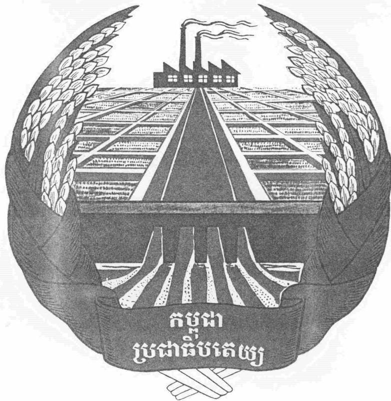
ARMOIRIES NATIONALES DU KAMPUCHEA DEMOCRATIQUE