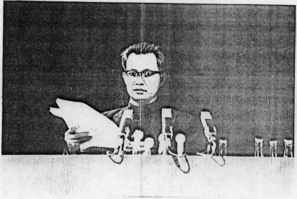
បិត្ត ខៀវ សំផន ប្រធានគណៈប្រធានរដ្ឋសុត្រសុទ្ធតា ទៅសន្និសីទកំពូលលើកទី ៥ នៃប្រទេសមិនចូលបក្សសម្ព័ន្ធ ទៅភ្នំព្រួញ

យើងខ្ញុំ សូមសំដែងអំណរសរសើរ យ៉ាងរីករាយ និង កក់ក្តៅបំផុត ចំពោះគណៈប្រតិភូបណ្តាប្រទេស ដែលបាន ដណ្តើមជ័យជំនះ យ៉ាងត្រចះត្រចង់បំផុត លើចក្រពត្រនិយម អាណានិគមនិយម ហើយដែលពេលនេះ ចូលមករួមក្នុងមហា ព្រៃសារ នៃប្រទេសមិនចូលបក្សសម្ព័ន្ធយើង ក្នុងថ្ងៃនេះជាសមាជិក ពេញលក្ខណៈ ។ នេះជាជ័យជំនះដ៏ត្រចះត្រចង់ របស់